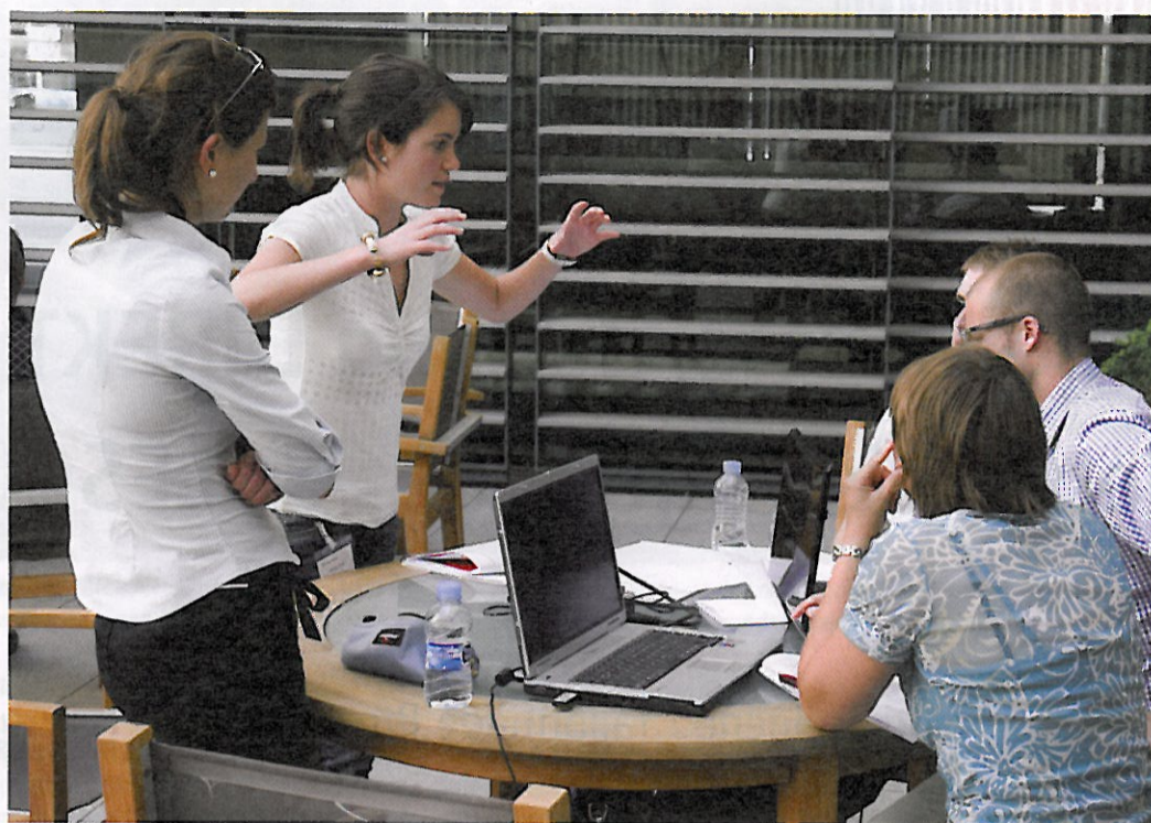
Aufmerksam: In Gruppenarbeit lösen die Studenten Fallstudien aus dem Handel. Im Seminar erhalten sie Einblicke in die Retail-Welt.

Mit der Teilnahme bekamen Studierende die Möglichkeit, sich den Firmenvertretern vorzustellen. Sie bearbeiteten im Team Fallstudien zu künftigen Herausforderungen der Partnerunternehmen des Retail-Lab. „Die Retail Talent Career Days gaben mir einen realistischen Einblick in die Pro-